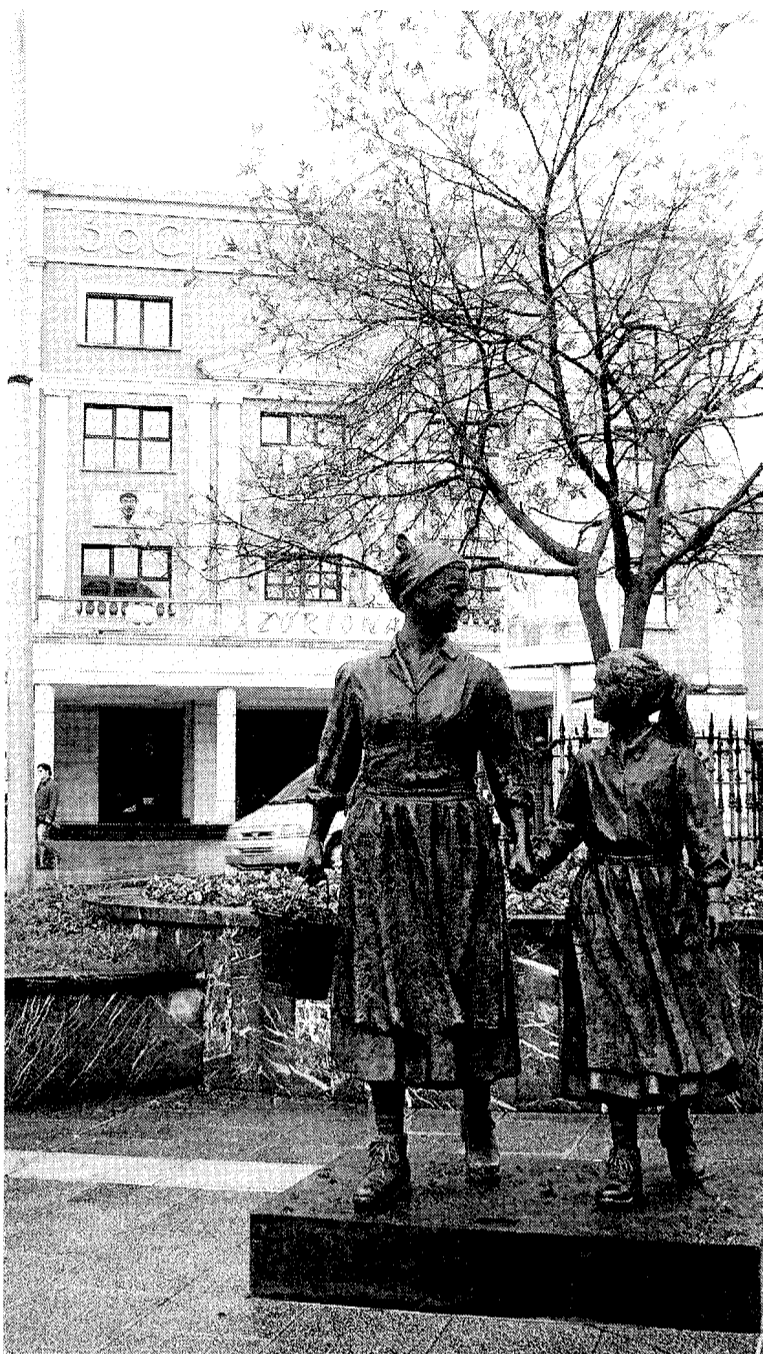
El homenaje a los alcaldes tendrá lugar en El Social.

TAPAR LOS PROBLEMAS REALES Para los jeltzales, estas celebraciones que llevan desarrollándose en el municipio desde 2008, deberían ser "de todos los vecinos del pueblo y no de unos pocos". Este equipo de gobierno, prosiguen, "en vez de plantear